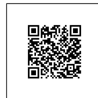
Zažádejte o vytyčení

Přílohy: Orientační zakres plynárenského zařízení, Detailní zakres plynárenského zařízení, Ověřená příloha žadatele